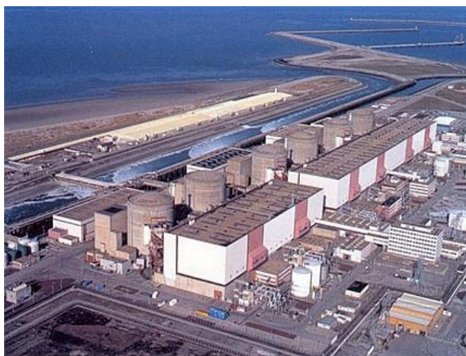
Photo du site de Gravelines

Les rejets ainsi que le prélèvement et la consommation d'eau de la centrale nucléaire de Gravelines sont réglementés par les décisions citées en référence [3].