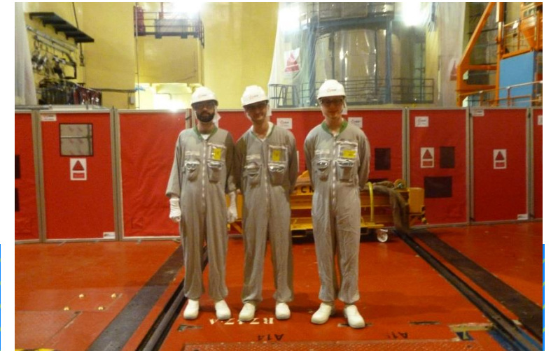
Espace Odys Elec